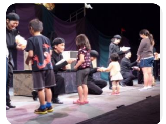
【劇団へのプレゼント渡し】