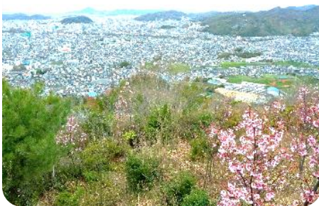
淡路が峠からの景色

日時：2022年3月27日(日) 9時から13時 会場：淡路が峠・よかたの森(松山市畑寺) 参加者：41名(大人21名・子ども20名) スタッフ：12名